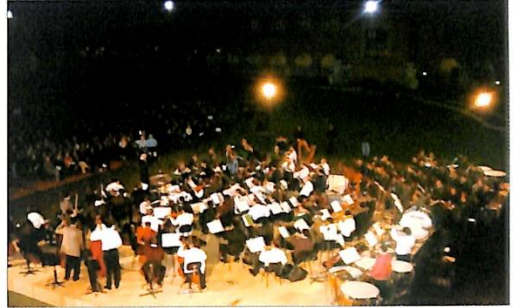
Orquestra Sinfônica e nossa Banda de Música