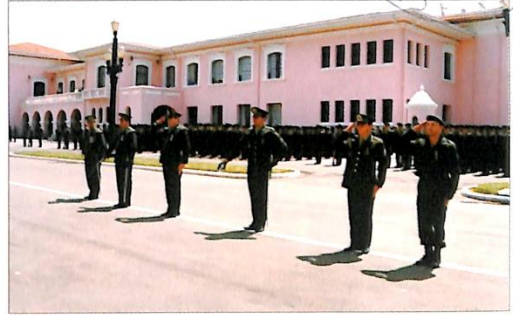
Entrega de Medalhas