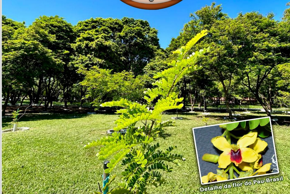
Detalhe da flor do Pau-Brasil

O pau-brasil ou pau-de-pernambuco (atual Paubrasilia echinata (Lam.) Gagnon, H.C.Lima & G.P.Lewis, antiga Caesalpinia echinata Lam.), também chamado arabutã, ibirapiranga, ibirapitã, ibirapitanga, orabutã, pau-de-tinta, pau-pernambuco e pau-rosado, é uma árvore leguminosa nativa da Mata Atlântica, no Brasil.