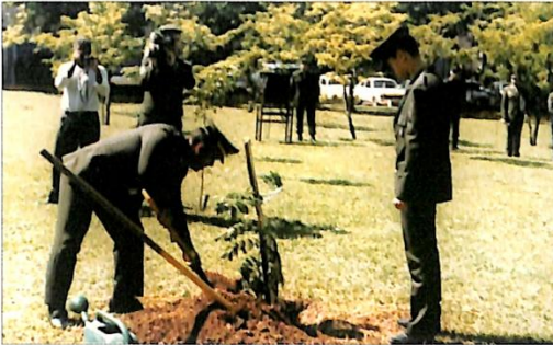
Plantio do 56º Pau-Brasil