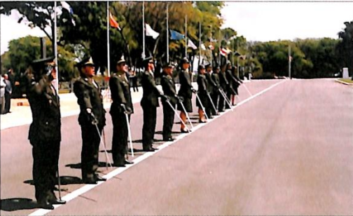
Compromisso ao 1º Posto