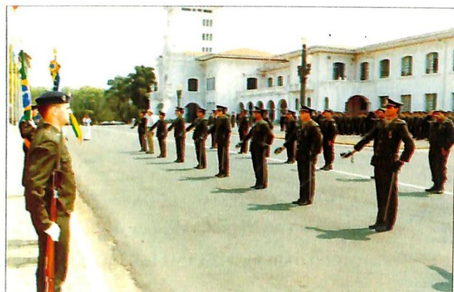
Distinção - Recebimento de Medalhas