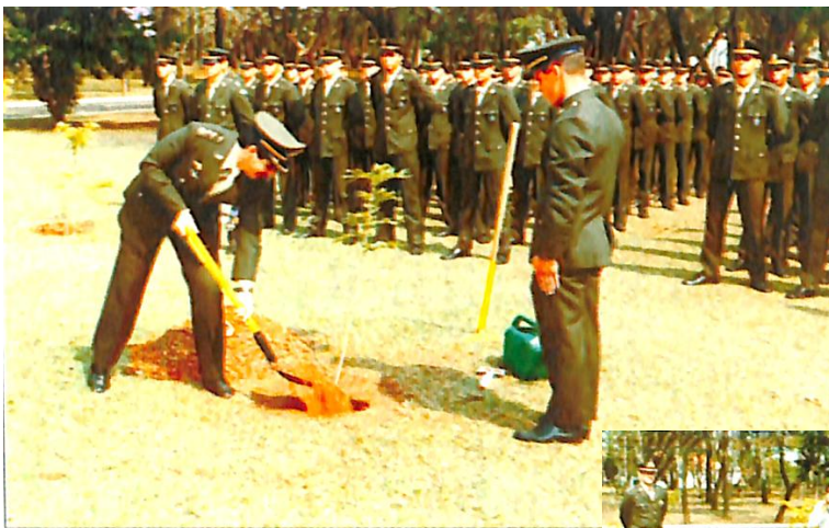
Plantio da 55ª muda de Pau-Brasil