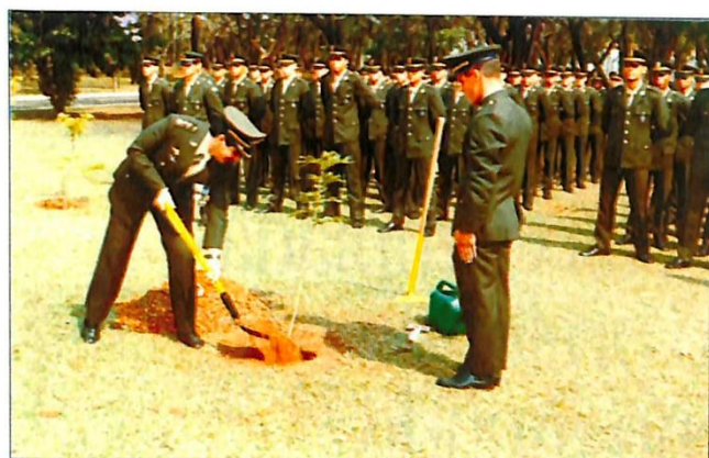
Plantio do 55º Pau Brasil no Bosque das Tradições