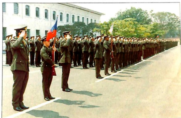
A Tropa Formada