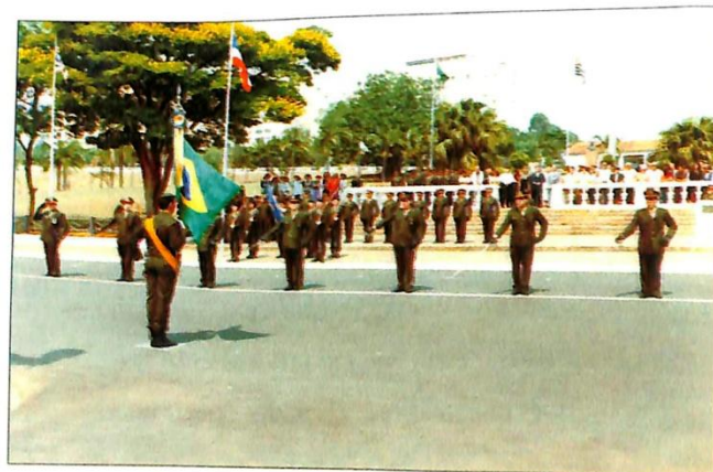
Compromisso ao 1º Posto