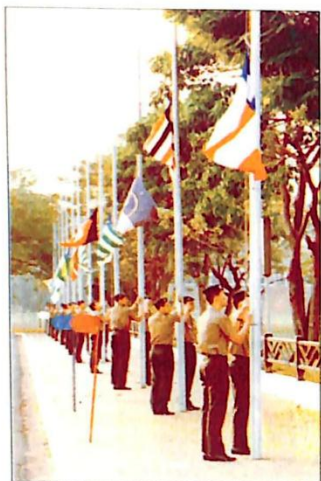
Hasteamento do Pavilhão Nacional e Bandeiras dos Estados